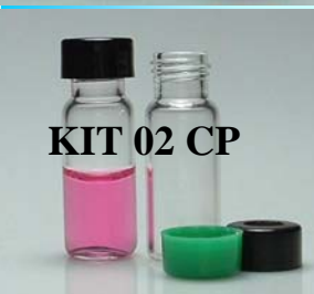
KIT 02 CP