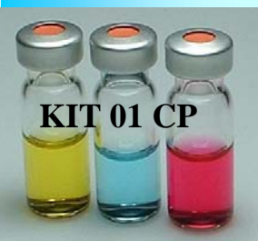
KIT 01 CP