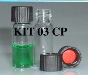
KIT 03 CP