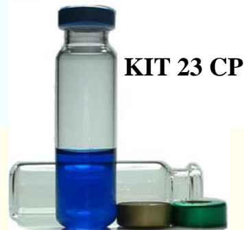
KIT 23 CP

flaconi, chiusure e accessori per laboratori analisi